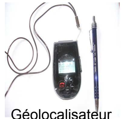
Géolocalisateur pour patients fugeurs