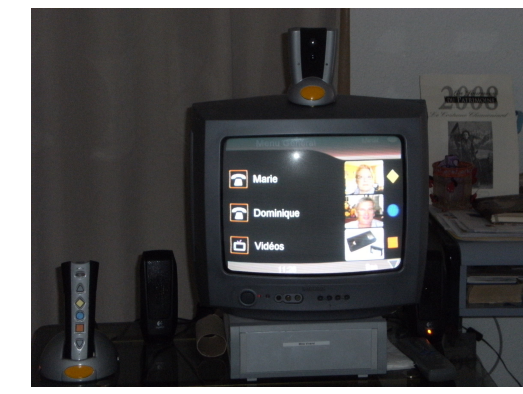
Télélien social en EHPAD et à domicile