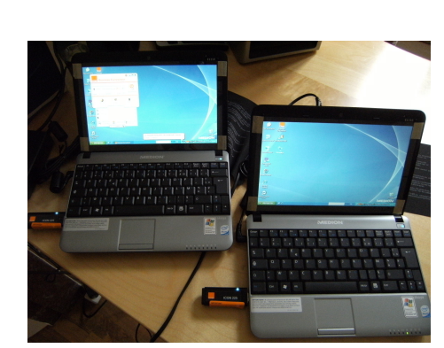
Ultras PC pour SSIAD