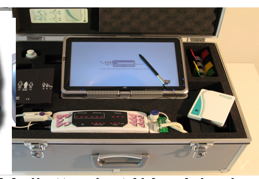
Mallette de télémédecine d'urgence