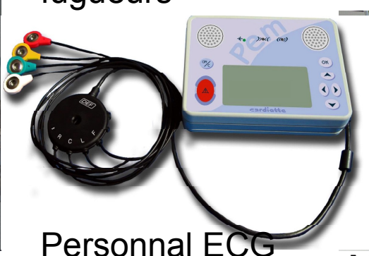
Personnal ECG Monitor (PEM) en refuges